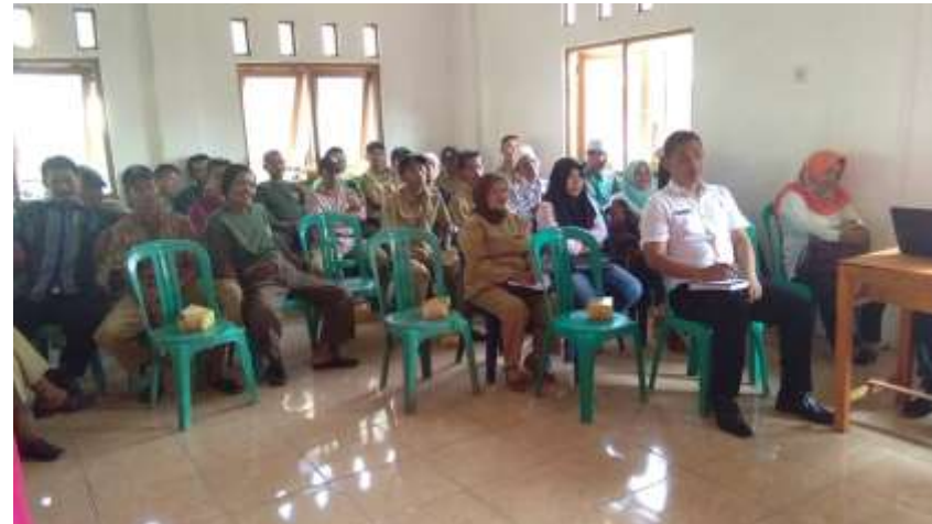
Kegiata Musyawarah Perencanaan Pembanunan SAMISADE Pada Tahun 2020